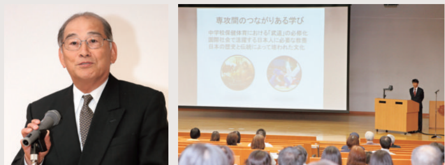
昨年の保護者懇談会の様子

改めて開催案内をお送りいたしますので、大学における様々な施策・活動へのご理解をいただくため、是非ともご出席くださいますようお願いいたします。